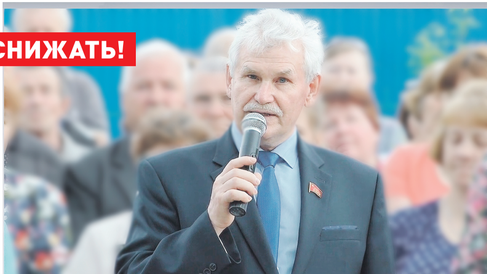
ОБРАЩЕНИЕ ЖИТЕЛЕЙ Г. НОВАЯ ЛЯЛЯ К ПРЕЗИДЕНТУ РФ В.В.ПУТИНУ 11.06.2019

В итоге городские власти были вынуждены согласовать площадку для проведения собрания, куда мы вновь пригласили и Главу городского округа, и местных депутатов, и Прокурора Новолялинского района. Но все они вновь проигнорировали данное мероприятие, зато пришли более 500 жителей Новой Ляли и десятки тысяч посмотрели онлайн. Напомним,